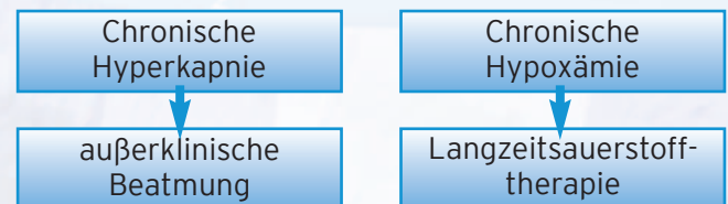
Tabelle: Therapie der Chronischen Ateminsuffizienz

Hypoxämie - Sauerstoffmangel im arteriellen Blut.